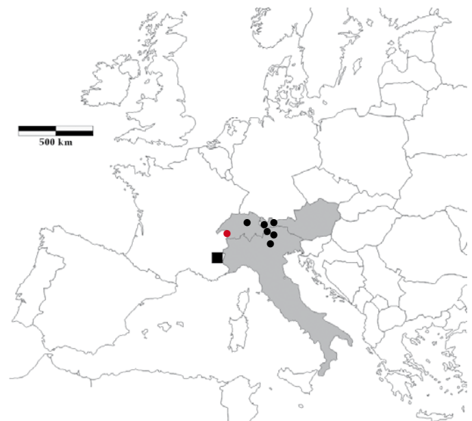
Figure 5. - Carte de répartition d' Arctosa renidescens : en gris, pays où l'espèce est connue ; points noirs, localités connues (NENTWIG et al. , 2019), point rouge, localité de SCHENKEL (1927) ; carré noir, donnée française.