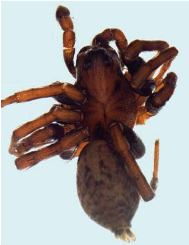
Figure 3. - Habitus d' Arctosa renidescens , mâle d'Arvieux.

marques sombres sur le céphalothorax. Tous ces critères cumulés permettent de distinguer assez rapidement cette espèce (fig. 3). Les mâles font généralement entre 7 et 8 mm de long (NENTWIG et al. , 2019), les nôtres sont plus petits avec en moyenne 6,25 mm (6,20 ; 6,25 ; 6,29 mm).