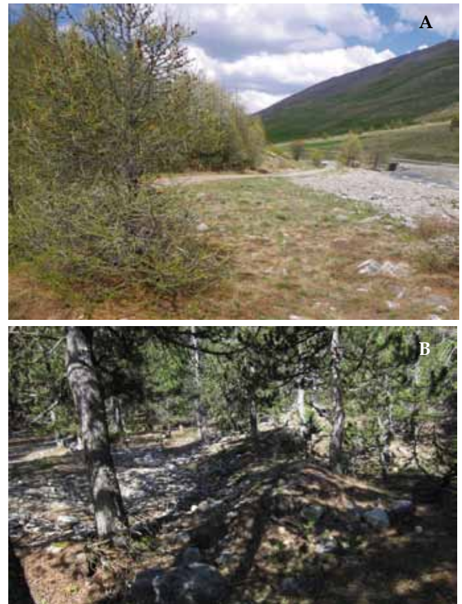
Figure 4. - Photos des sites de capture dans le PNR du Queyras : A, Pins à crochets, Arvieux ; B, Mélèzes en zone inondable, Molines-en-Queyras.

occidentales (fig. 5) d'environ 100km vers l'Est, 150km vers le sud; elle est séparée de 200km de la station la plus proche à Saas-Fee en Suisse (SCHENKEL, 1927).